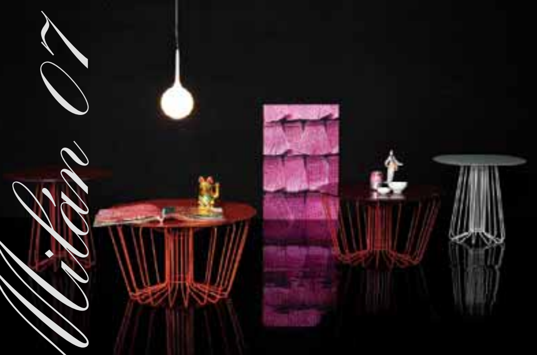
BIGWIRE OD ARIKA LEVYHO