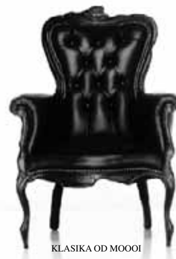
KLASIKA OD MOOOI

NOVÉ MATERIÁLY a jejich neobvyklé kombinace neušly pozornosti laické i odborné veřejnosti. Na obrázku můžete vidět modulární obkládací systém, který nabízí různé možnosti povrchové úpravy – perleť, kůže, jemné krystaly skla.... WALL FASHION