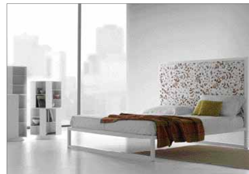
BÍLÁ JAKO ODPOVĚD