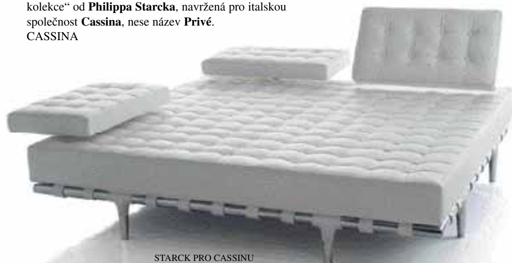
STARCK PRO CASSINU

PHILIPPE STARCK v bílé a černé. Nová „černobílá kolekce“ od Philippa Starcka , navržena pro italskou společnost Cassina , nese název Privé . CASSINA