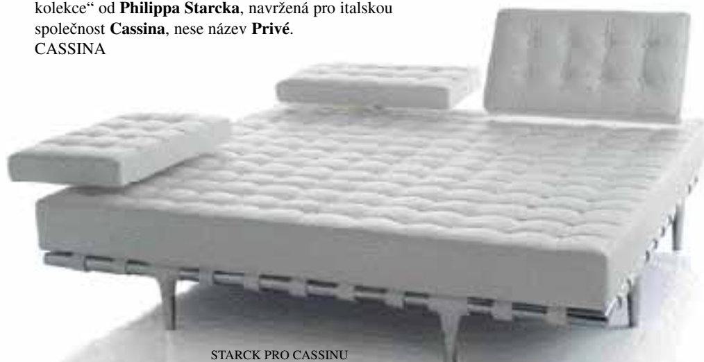
STARCK PRO CASSINU

PHILIPPE STARCK v bílé a černé. Nová „černobílá kolekce“ od Philippa Starcka , navržená pro italskou společnost Cassina , nese název Privé . CASSINA