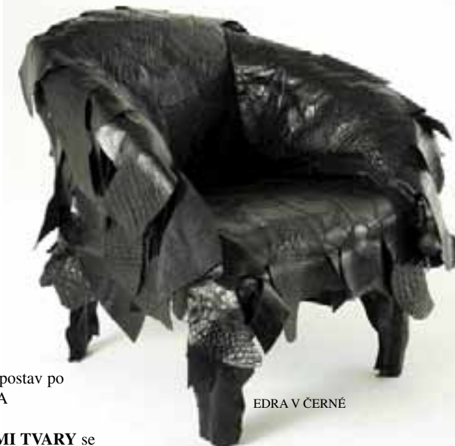
EDRA V ČERNÉ

BÍLÁ BARVA neznamená nedostatek invence. Je spíše odpovědí designérů na naši touhu po odlehčení a vzdušnosti v našem okolí, a tím i větším prostoru v nás samotných. MDF ITALIA