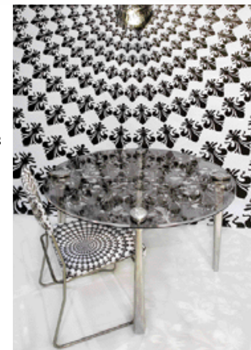
OP-ART V NOVÉM