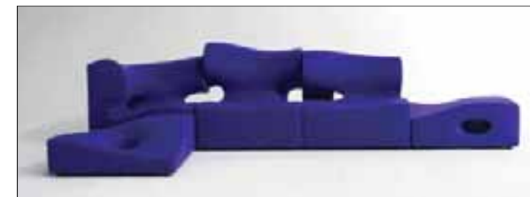
ZVLNĚNÉ VIDĚNÍ RONA ARADA