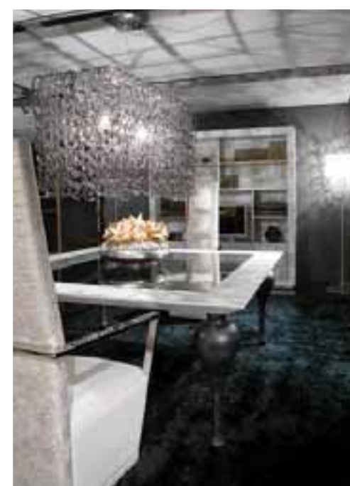
JAKO MÓDNÍ KREACE