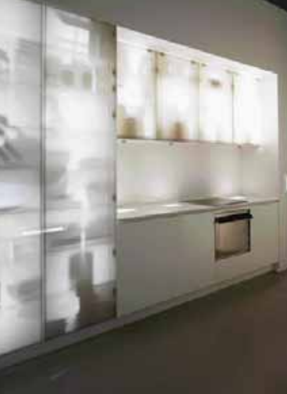
NOUVEL VERSUS CORIAN

JEAN NOUVEL představil ve spolupráci s firmou Du Pont Corian futuristický projekt bytu vytvořeného z corianu. DU PONT CORIAN