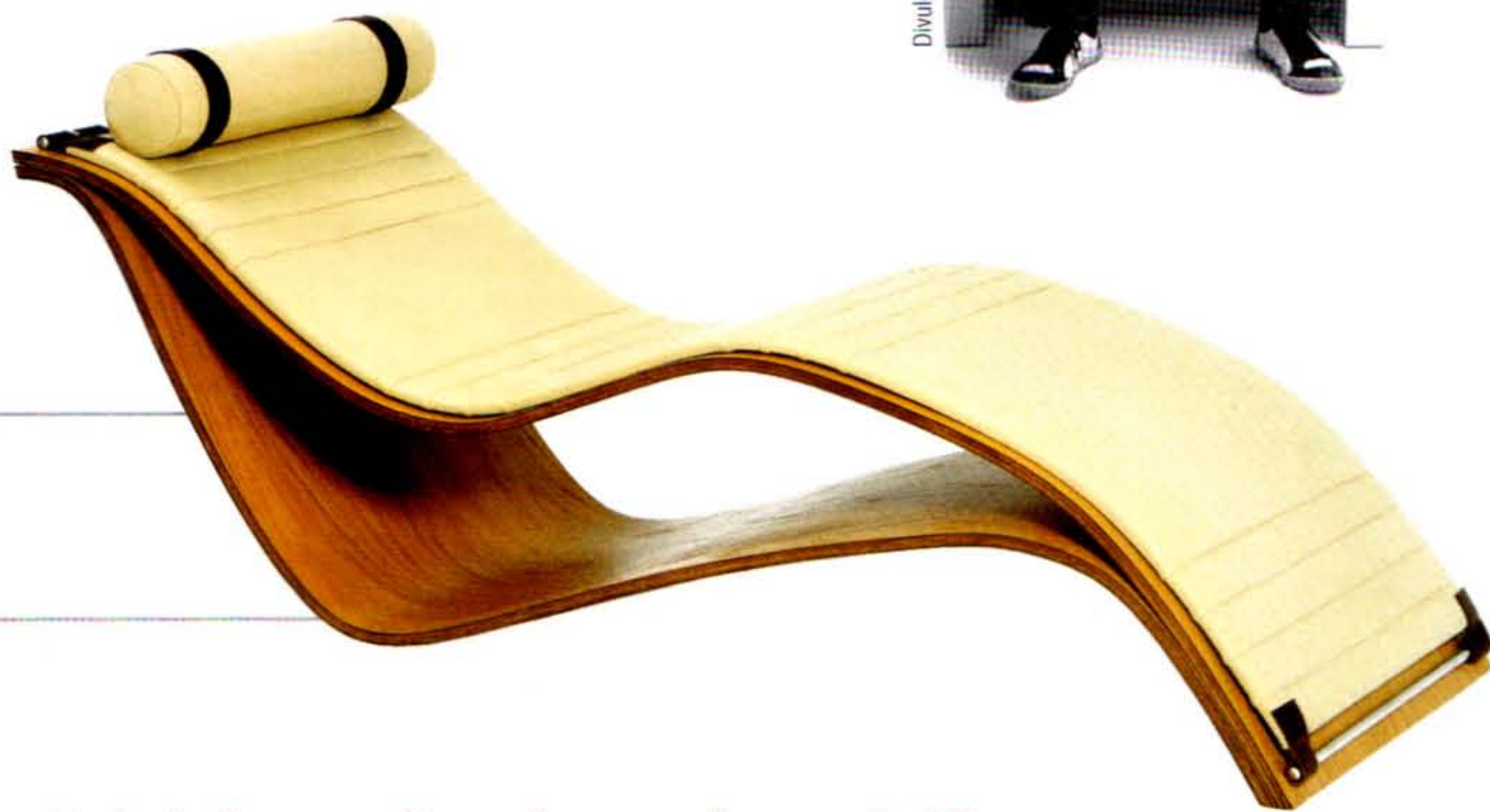
CHAISE SU Rafael Miranda

Carvalho natural e couro manteiga 0,71 x 1,95 x 0,78 m