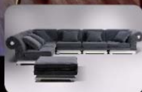
sofás de alta costura