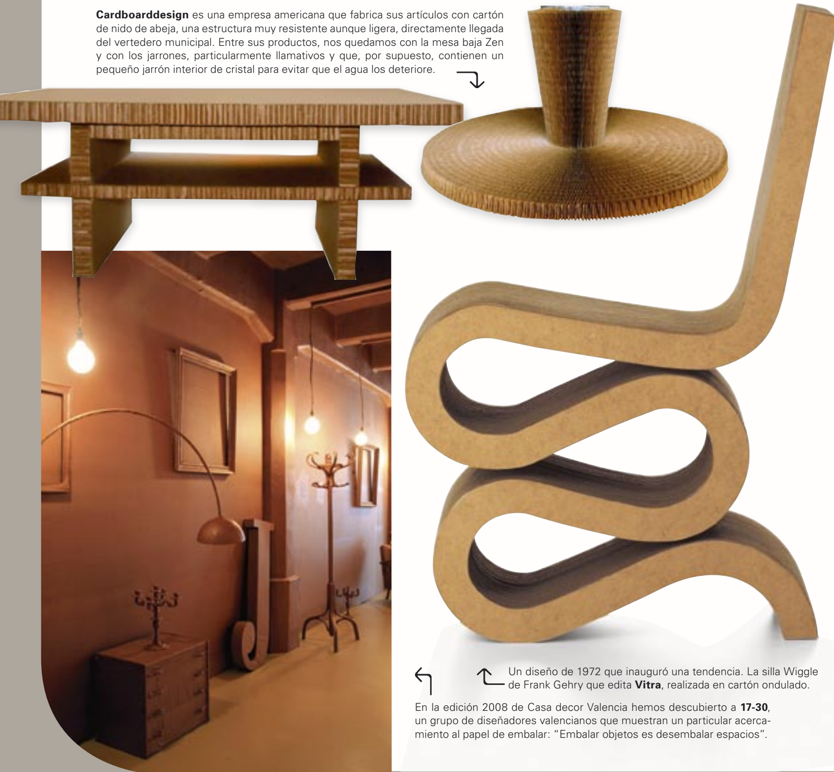
Un diseño de 1972 que inauguró una tendencia. La silla Wiggle de Frank Gehry que edita Vitra , realizada en cartón ondulado.

Cardboarddesign es una empresa americana que fabrica sus artículos con cartón de nido de abeja, una estructura muy resistente aunque ligera, directamente llegada del vertedero municipal. Entre sus productos, nos quedamos con la mesa baja Zen y con los jarrones, particularmente llamativos y que, por supuesto, contienen un pequeño jarrón interior de cristal para evitar que el agua los deteriore.