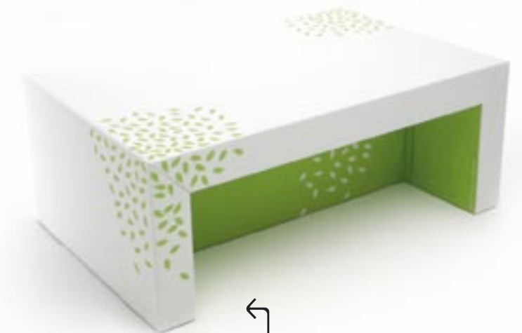
Rafael Simoes Miranda es un diseñador fascinado por el cartón. Su mesa Doca, versión otoño, se monta en apenas cinco minutos y es muy resistente, además de amiga de la naturaleza.

¿Quién es la más bella del reino? Un mensaje vitalista y lleno de optimismo para mirarte cada mañana. Es un espejo de Oppure Design .