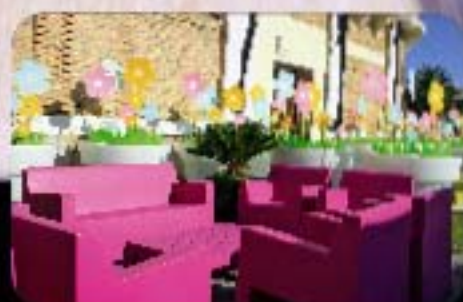
casa decor valencia